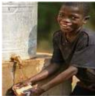
A hand-washing station at a UNICEF supported school in Lobaye Province, Central African Republic.